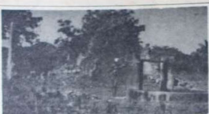
MSIKITI WA Shakombo kama ulivyo hivi sasa huko Mtongwé Vijijwéni.

Tumeona mfano wa Khamis Secondary School ambapo katika shule hivyo wanatunzi kidogo tu ndio Waislamu. Na pia kuanzia mwakani hii como la Dini ya Kiislamu, halitakuwa moja wa masomo ya mitihani.