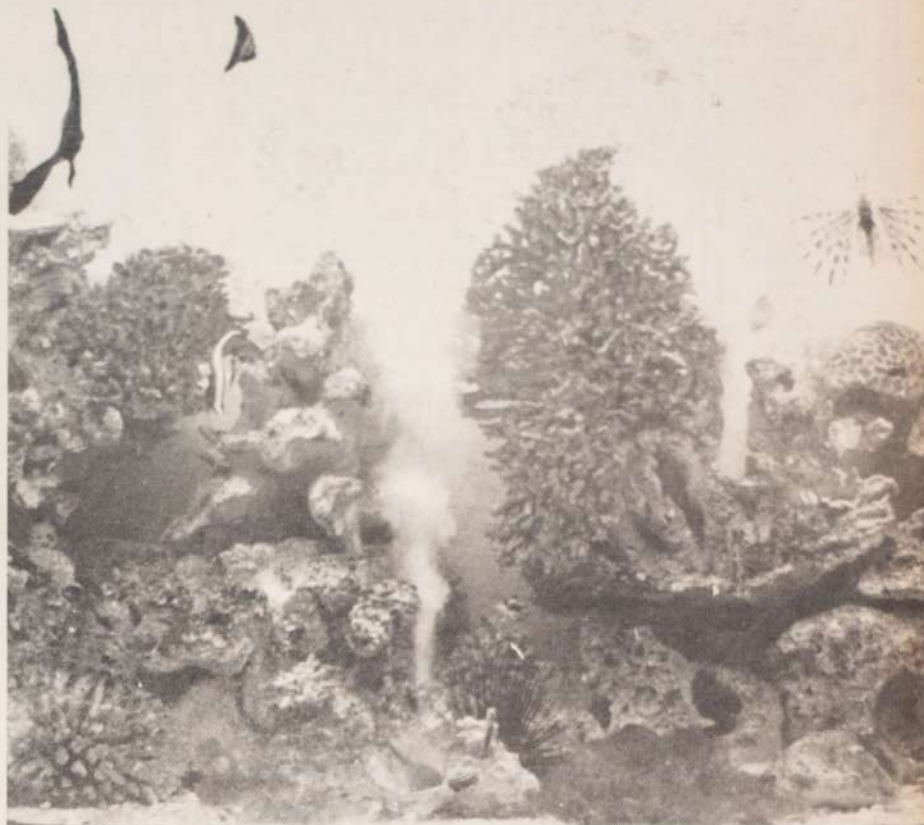
• BUNTE TROPISCHE Fische verstecken sich in den bizarren Korallengebilden

Die Meeresbewohner mit ihren skurrilen Gestalten koennen sich in ihrer Umwelt noch voll entfalten: Karmesinrote Seesterne, gruene Wasserschildkroeten, orange Schwimmschnecken, schwarze und blutrote kurzstachelige Seeigel, blauegelupfte Klippfische, gelbe Engelsfische, getigerte Aale, weissesprenkelte Dominofische, gestreifte Clownfische, ockerfarbige Seeanemonen, aufgeblasene Igelartige, Leopardenschnecken, Zebrafische, rauerbische Barrakudas, flache dreieckige Stachelrochen, stolze Einhornfische, wachsamer Tintenfische, die sich bei drohender Gefahr