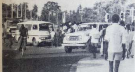
GARI YA Abiria ya matatu kigongana na gari ndogo karibu na daraja lipya la Nyali wakati taa za kuongeza magari zilipo harabika ghafla hivi majuzi. Picha hii yaonyesha watu wakizunguka gari la matatu lililushika na ajali hiyo.

Jawabu za fumbo hili lipelekwe kwa Mubarrir, COASTWEEK, Sanduku la Posta 87270, Mombasa, Kenya. Siku ya Alhamisi tarehe 27.11.80 saa sita mchana shindano hili litakuwa mwisho.