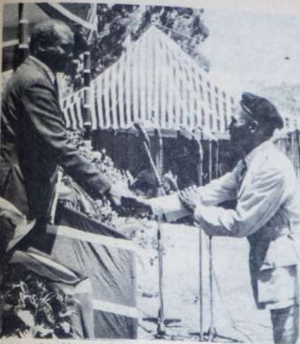
RAIS MOI akimpongeza mmoja wa machifu walio zawadia heshima ya kitaifa kwa kazi yao bora katika ikulu ya Nairobi hivi karibuni.