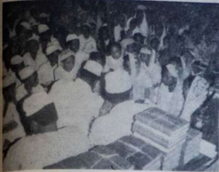
WANAONEKANA wanafunzi wa Hudaa Muslim School na walimu wao.

WANAMUZIKI MASHUHURI wa Osibisa kutoka Uingereza wanatarajiwa kuwatumbuiza mashabiki wao hapa mjini hapo kesho Jumamosi kuanzia saa moja na nusu usiku hadi saa nne katika uwanja wa Munispaa Mombasa. Tikiti zapatikana sehemu zote mjini.