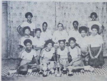
Hii ni timu ya Mpira wa kikapu (netball) kutoka Mombasa High School, wanaonekana pamoja na mwalimu Mkuu wa skuli hiyo pamoja na walimu wengine.

Na sisi twasema kwamba hata ikiwa pesa zitaleta mzozi iwapo watu watapendana ndilo jambo muhimu, na haya ndiyo maongozi ya Nyayo.