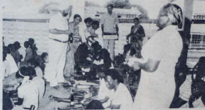
UMOJA WA Lions Club Pwani, hivi juzi waliwapa watoto wa Port Reitz vyakula na