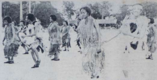
WACHEZAJI WA ngoma za Kitamaduni kutoka Ethiopia wakati wakimtumbua Mtukufu Rais