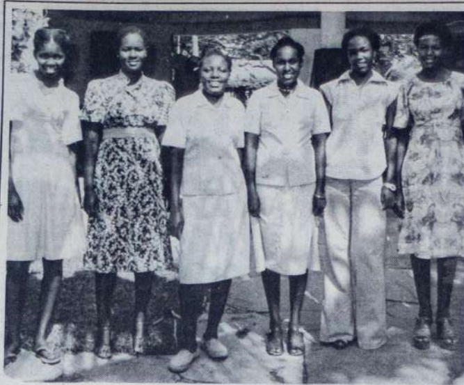
AKINA MAMA Kenya wanatwaa nafasi muhimu katika shughuli za huko Malindi na kuwa timamu Utalii. Hapa wafanyi kazi akina kutumikia Utalii Kenya.