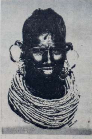
AFRIKANISCHE GESICHTER: Einige der ausgezeichneten Grafiken des Künstlers Fabby, die in der Ausstellung Jette und Fabby Show