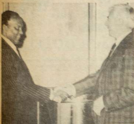
SHUKRANI-WAZIRI wa Ardhi na Makao, Bw. Paul Ngei (kushoto) anamshukuru Balozi wa Uingereza nchini Kenya, kwa zawadi yake ya Mzinga wa Asali wakati alipomtembeloa alisi yake mimi Nairobi.