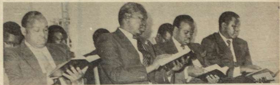
MAOMBI-MTUKUFU Rais Daniel arap Moi akihudhuria kwenye