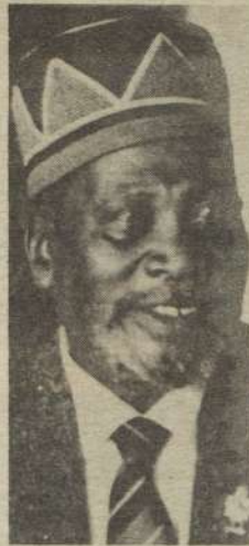
• MZEE KENYATTA

MOMBASA ni mmojawapo ya miji ambayo ilijitokeza kwa sura mpya wakati huo ambapo nchi yetu inashereheka sikuku ya kuadhimisha miaka 20 toka nchi yetu ijinyakulie Uhuru wake na hadi leo, mapambo hayo yanaonekana kwenye barabara kubwa za mji yetu huu wa Mombasa ambao unajulikana kama mji wa pili mkubwa katika Kenya.