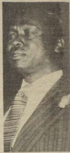
• RAIS MOI

HAKIKA tulistahili kusherehekea Uhuru wetu kwa kila aina ya tamasha na tafirja na pia kuipamba miji yetu ili wale wakoloni waliokuwa wakitutawala waone vile hatua kubwa tuliyopiga toka tujinyakulie Uhuru kutoka kwao, hatua ambayo ni wazi ni ya maendeleo ya kudumu.