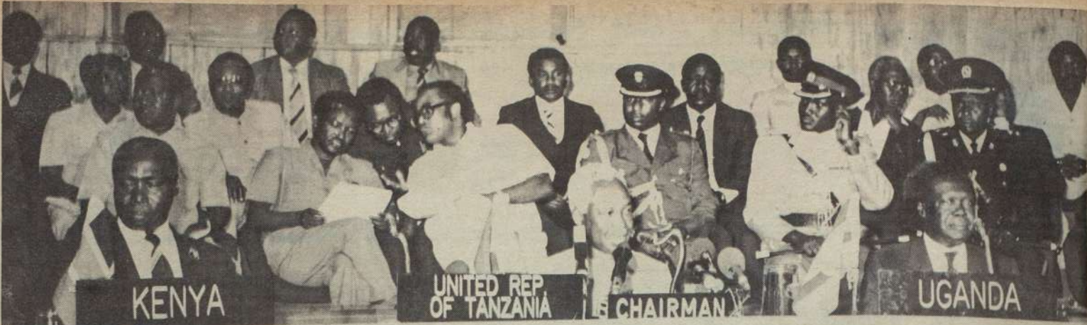
MARAI Moi wa Kenya, Nyerere wa Tanzania na Obote wa Uganda katika mkutano wa Kihistoria uliofanyika Arusha ambapo msingi