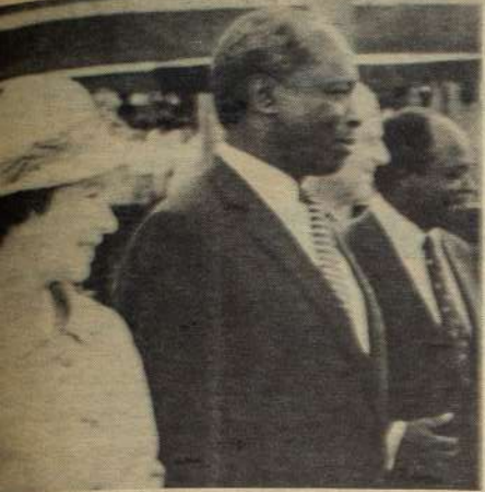
MALKIA Elizabeth Wa Uingereza pamoja na Mwami Moi wakitumbuizwa na wacheza ngoma maridadi ya Malikia kuwasili kwenye uwanja wa jamaa yaatta kuanza ziara ya Kiserikali nchini.

INGAWA wengi walizidharau timu za Somalia na Zanzibar, lakini ukweli ni kuwa timu hizi mbili zitasumbua sana Malawi na Zimbabwe kwenye kundi la "B" na hatokuwa ajabu ikiwa moja ya timu hizo niizozitaja hapo awali itaweza kusonga mbele katika michuano