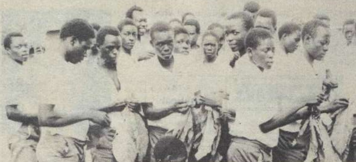
Wanafunzi wa Ngai wanajishughulisha kuchambua Tumbaku na kuweka kwa gredi tafauti.

Miji mingine ambayo tuliyotembelea ni pamoja na Masaka, Mbarara, Lira, Fort Portal, Hoima, Gulu, Pakwach, Nebbi, Tororo, Soroti, Mbale, Mbale na mji mkuu wa Kampala. Ziara hiyo ilikuwa ya kazi na muda tuliotumia ni karibu mwezi mzima.