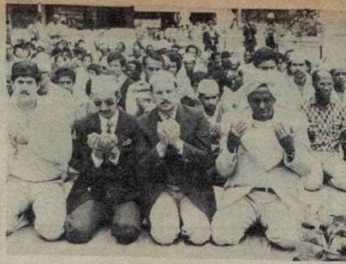
IDD: MAELFU ya Waislamu watajumuika katika Msikiti mbali kwa swala wa Idd. Pichani wanaonekana Waislamu katika Msikiti...