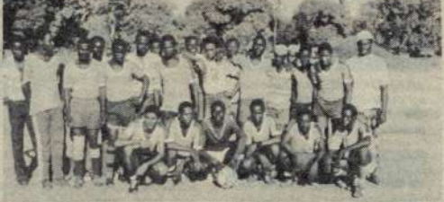
MAJOGOO: VIJANA hawa wakakamavu na wenyewe moyo wa kulisakata kabumbu...