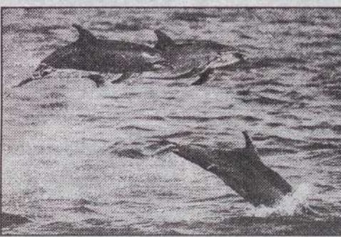
DIE SPIELSTUNDE hat offenbar gerade begonnen!

Die Delfine zogen eine Gruppe um die Dhuu, so daß die Gäste eiligst von einer Gruppe auf die andere kletterten, um eine bessere Aussicht zu haben.