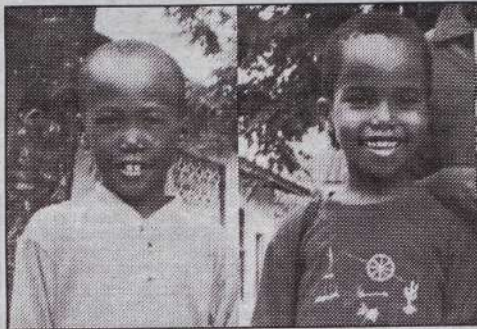
SIE HABEN allen Grund, sich zu freuen, denn sie haben gerade von A.C.T.S. gehört, daß ihr Schulbesuch auch im nächsten Jahr gesichert ist.

Gegenwärtig werden von A.C.T.S. 110 Kinder gesponsort, davon 48 in der Upendo Primary School (Schulgeld, Uniform und Bücher Shs 5.000 pro Kind pro Jahr), 31 in anderen Primarschulen rund um Mombasa, 25 in Sekundarschulen und 6 in