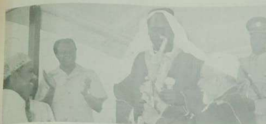
KADHI Mkuu wa Kenya Sheikh Abdalla Saleh Faris anaonekana akimtunza Rais Moi vitara na wazi kambi la Mzee wa Kisilamu wakali Rais alipozuru jengo la Islamic Centre Mombasa.