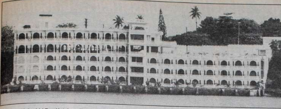
DAS NEUE Orchid Bay Hotel am Tudor Creek bei der Nyallbrücke sieht wie ein märchenhafter Sultanspalast aus.