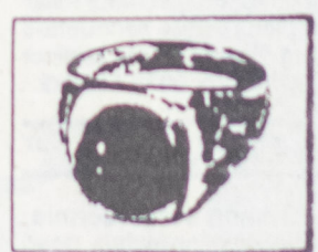
Ein 18karätiger Goldring mit Cabochon Rubin.

Korundkristalle sind hexagonal, eine Mischung aus kristallisiertem Gas, Sauerstoff, Leichtmetall und Aluminiumoxid. Die rötliche