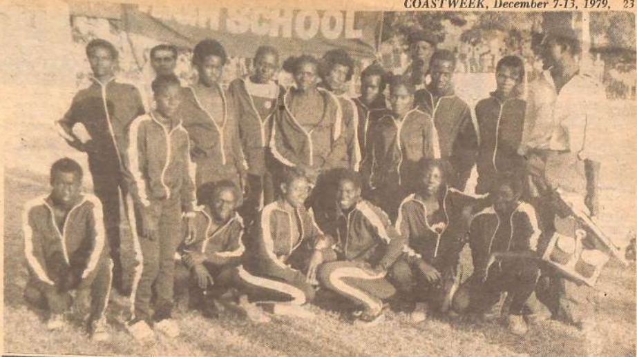
• SHULE ya Mombasa High School imenyakua ushindi-na kuwa Bingwa wa michezo mbali mbali Pwani na Taifani alisema wanafunzi wa shule hiyo vile vile wamefauzi vizuri katika maunzo yao.