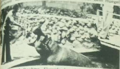
Das halbruhme Flusspferd wird vom Assistenten gefuellt.