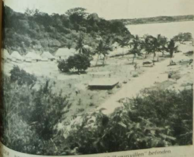
Die 10 "Luxusvillen" befinden sich am "Seahorse Club".

GO... where the action is... every Saturday and Wednesday. Mombasa's most popular ANWAR'S DISCO KARAGANA CEANVIEW BEACH HOTEL Oceanic Hotel every Wednesday and Saturday NEW DISCO ATLANTIS BY SATTAR GENTS 20/= COUPLES 20/= LADIES 10/= Cistral Cocktail Bar Cuisine, Lobsters, Sattar Bank 24911