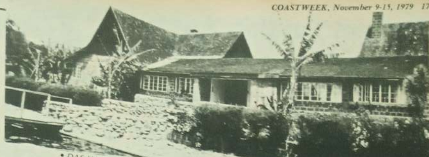
Das HAUPTGEBAEUDE der Lake Nakuru Lodge.

gelegenen, vereint die Lodge neuem Baustil und bietet den Besuchern ein unvergessliches, einmaliges Panorama.