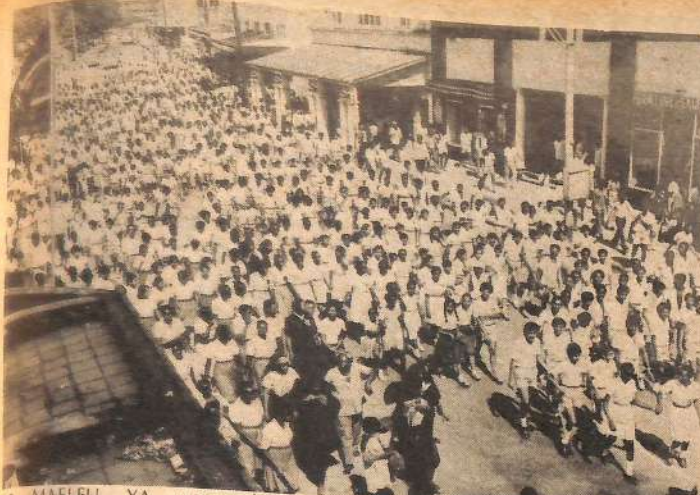
MAELFU YA wananchi wa Mombasa wa kabila na dini zote hivi majuzi waliandamana kudhihirisha imani yao na upendo wao kwa Mtukufu Muadhama mpendwa Rais Moi.