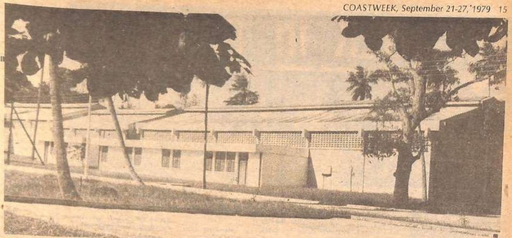
• EINE DER Fabrikhallen, die den Unternehmern zu guenstigen Bedingungen zur Verfuegung gestellt werden.

Nicht weit entfernt von der Mombasa-Isirobi-Strasse, in der Naehere der Oelraffinerie gelegen, bietet das Industrial Estate mit seinen