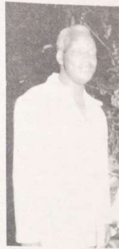
Bw. I. K. Salat akihutubwa katika tafrija HIYO.