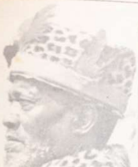
Hayati Mzee Jomo Kenyatta, Rais wa Kwanza wa Taifa la Kenya

WAKENYA WASHEREHEKEA Siku Kuu ya Kenyatta. Hino ni ya kumi na nane tokea kuniyaku Uhuru toka kwa Wakoloni. Hii ni siku ya kukumbusha wapigania uhuru wa nchi ya Kenya. Wote wale ambao walijitolea kwa damu, mali, jasho na mawazo hadi uhuru ukanyakuliwa. Waliopigana misituni na pia wale waliokuwa wakiwatibu majunghi na kuwaandalia vyakula wote wastahiki sifa ya ughujaa. Na twafahamu kwamba Jemedari Mkuu wa vita hivyo vya kimwili na vya kimawazo si mwengine ila ni Marehemu Mzee Jomo Kenyatta mwanzilishi wa Taifa huru la Kenya. Leo hatuna budi kumuomba Mungu amrehemu kutika malazi yake.