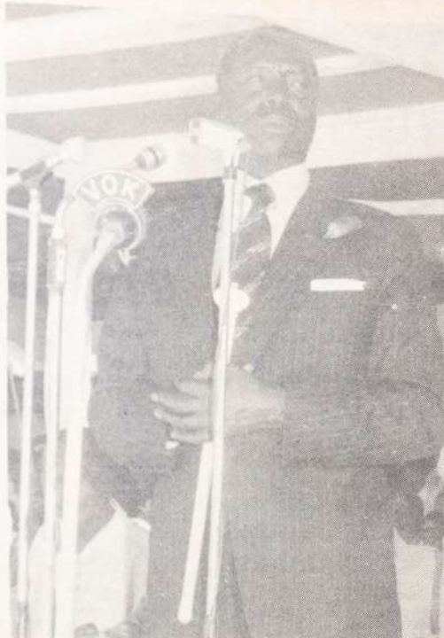
MTUKUFU Rais Daniel Arap Moi ambaye katika sherehe za Kenyatta Day aliwahimiza wananchi kujizatiti na kulinda Uhuru wa nchi yao ulufu ya Kenya.