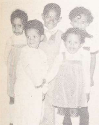
WATOTO WALIO jaa turaha tele wakiwa wamevalia maridadi tarani kwa sherehe za Idd-ul-Hajj. Kutakuwa na michezo ya aina mbali mbali kuwafurahisha watoto kama hawa katika maonyesho ya Makadara.