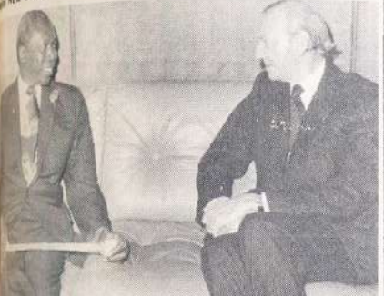
RAIS MOI akihojiana na Katibu Mkuu wa Umoja wa Mataifa, New York.