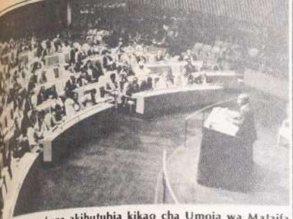
RAIS MOI anonekana akihutubia kikao cha Umoja wa Mataifa New York.