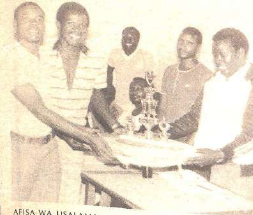
AFISA WA USALAMA wa Kampuni ya Kenya Breweries Limited, hodha wa vilabu vya Regal "a" na Bandari ambaye akikwamba "Challenge Cup" lililotelewa na kampuni hiyo. Timu hizo mbili zilishikilia pichani ni Maafisa wa Chama cha Darts cha mkoa wa Pwani.