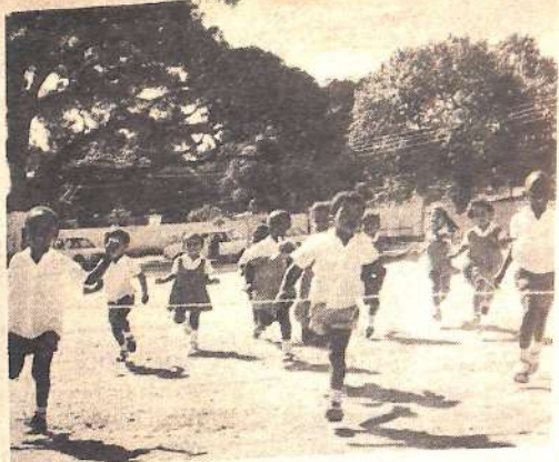
KIPCHOGE WA BAADAYE! - Vijana hawa wa Shule ya Upili ya Almeida Day Nursery School wanaonekana wameanza matayarisho ya mapema ya kutumia mbinu wakati wa siku ya wazazi; siku ambayo wazazi walifika na kujionea wenyewe maendeleo ya watoto wao.