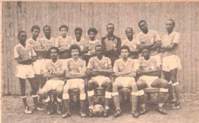
HAWA NI vijana wanaojulikana kama Kamiti Tanners FC kutoka Nairobi. Ni wanandinga mashujaa ambao wameanza kujitokeza na kuonyesha mbinu za kulisakata kandanda. Katika michuano yao ya hivi karibuni, walipambana na miamba ya Mombasa, Nyundo FC na kufungwa 4-0 lakini wanasema, "tumejiunza na tutashinda siku nyingine".