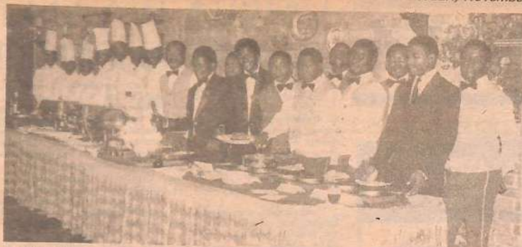
DIE KÜCHENBRIGADE, Kellner und weiteres vor und hinter den Kulissen arbeitendes Personal, denen der "Maxim's Cellar" seinen Erfolg verdankt.

SEIT SEINER Eröffnung vor fünf Jahren im Mombasa Beach Hotel hat die Beliebtheit dieses gepflegten Grillrooms stets zugenommen, denn die Geschäftsleitung glaubt nicht an einen Stillstand, sondern legt größten Wert darauf, die Dienstleistungen im Maxim's Cellar ständig zu verbessern und durch neue Ideen abwechslungsreich zu gestalten.