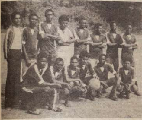
Wachezaji wa Libati Heroes, Majengo ambao walishiriki katika ligi ya 4 Mombasa mwaka huu.