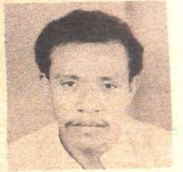
• BW. BATHWAB

Bathwab alinambia kuwa amejifunza aina nyingi za chakula ambacho kinauzwa hapo hotelini kama pilau, wali mweupe, sima, taco salads, sand-