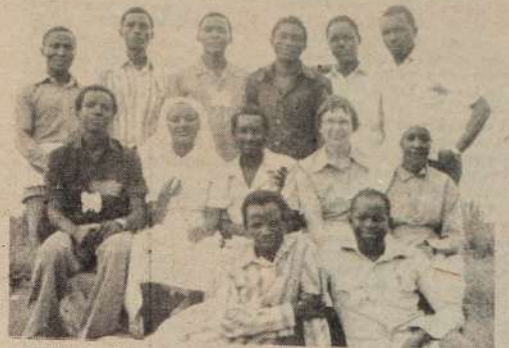
HILI NI kundi la waalimu wa msingi kutoka Kwale baada ya kumaliza waksha yoo juu ya elimu ya dini katika msheni ya Samburu mwaka huu.

maadili kama vile nasaha. Kwa mfano, mshairi mmoja maarufu sana alikuwa ni mwanamke aliyetwa Mwana Kupona binti Mshamu. Alishi katika mji wa Pate Katika mwaka wa 1858 alitungwa binti yake Mwana Hashima binti Sheikh Mataka "Utenzi wa Mwana Kupona" kumwusia jinsi ya kuishi vizuri na mume na kwa jumla jinsi mwanamke anavyopaswa kuishi kwa kufuata maamirisho ya dini.