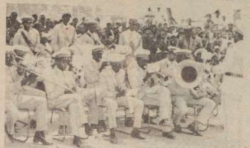
BANDI MARIDADI kutoka Bamburi Portland Cement ambayo iliwatumbuiza wananchi wengi waliohudhuria tamasha za siku ya elimu ya gumbara katika kituo cha shule ya Msingi ya Malele.