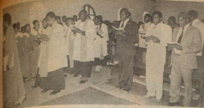
RAIS Moi akihudhuria misa katika la St. Barnabas Church, mjini Nairobi Jumapili iliyopita.