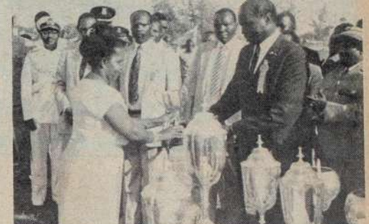
RAIS Moi akipeana kikombe kwa mshindi katika maenyesho ya kilimo ya Mombasa wiki jana.