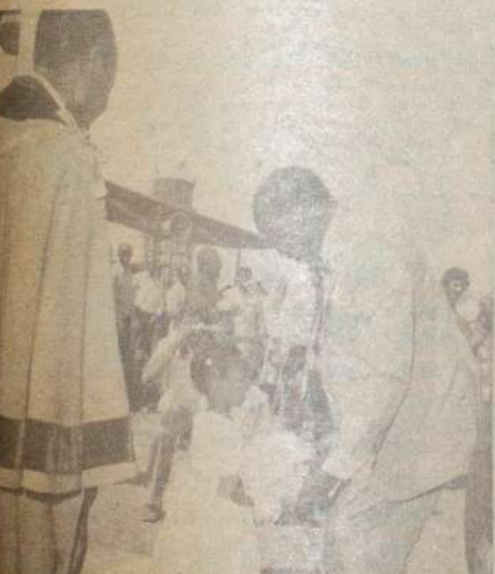
RAIS Moi akipokea shada la maua kabla ya kuweka jiwe la msingi katika shule ya utundi ya Sheikh Zayed mjini Mombasa.

Tokea hapo kazi ya mjumbe au diwani ni kujenga shule nzima au darasa zima sio kutafuta nafasi ya kijana mmoja. Kwani kura moja ya baba au mama wa kijana huvo haimfanyi mtu kuwa mbunge wala diwani. Wote waliochagua wanahaki ya kuhudumiwa bila ya ohuguzi.