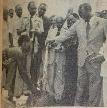
RAIS Moi akifungua Mfereji wa Maji huku Mwanamke umoja akichola maji baada ya Rais kufungua mpango wa Maji wa Barushi, Kilifi.

NATOWA pongezi zetu kwa makala yalochapichwa katika nakla ya gazeti la COASTWEEK mnamo tarehe August 20 1982, yalotowa kinaganaga fikra na ukweli ambao wengi katika waislamu walikuwa wa kuficha kwa sababu mbali mbali ambazo wenyewe wazifahamu. Ni juu ya kila muislamu kutowa fikra zake na maoni yake juu yakila lile ambalo aliona latendeka kombo kuhusu Dini.