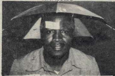
SWAHILI CROSSWORD NO. 135