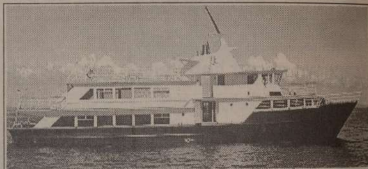
"BLUE LIBERTY" bietet regelmäßigen Fährdienst zwischen Shimoni und der Insel Pemba.

Pemba führt durch ein leuchtend blaues Meer; Delphine springen vor dem Schiff aus dem Wasser und an Bord wird ein erstklassiger Service von Offizieren und Mannschaft geboten.