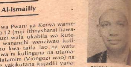
• BWANA Naaman Kilifi Tamim wa Mataifa