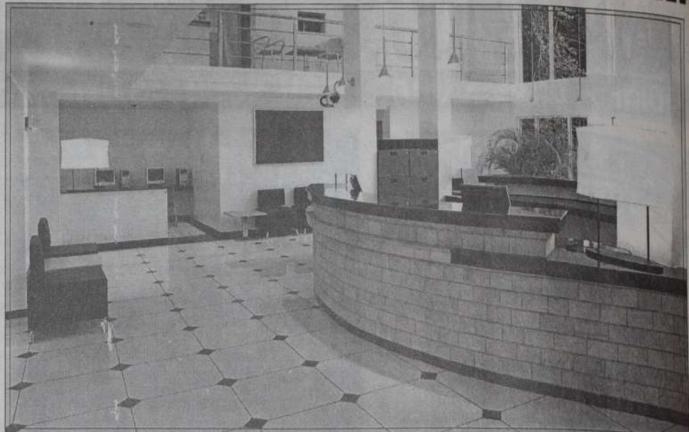
THE COUNTRY LODGE - Rezeption: Das Dekor ist minimal aber modern mit schwarz-weißem Eingang, Geländer aus rostfreiem Stahl, die Fußböden in den Zimmern aus Buchenholz.