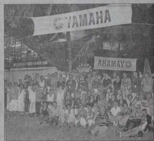
YAMAHA MARINE Händler aus Holland nach einem köstlichen Dinner mit Meeresfrüchten und Grillspezialitäten in Yul's Aquadrom am Bamburil Beach an der Nordküste von Mombasa.

Außer einem sagenhaften Dinner, gekrönt mit Yul's Eisspezialitäten, konnten die Yamaha Händler einen ganzen Tag mit dem Ausprobieren der neuesten Wassersportarten und den neuen Waverunner 1100 cc und 110 PS Motoren verbringen.