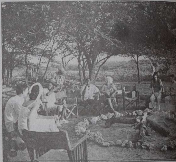
IM NGUUNI NATURE Sanctuary. Der ideale Ort, um sich mit Freunden zu treffen für Picknick und Partys wie auch für eine Hochzeit auf andere Art. Rund herum wandern friedlich Giraffen und Antilopen, während Sie einen spektakulären afrikanischen Sonnenuntergang erleben.

Mit den angelegten Teichen und Dämmen ist ein Feuchtgebiet entstanden, das viele Tiere wie Reptilien, Vögel