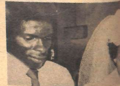
HARUSI ya kutana ilifanyika katika Kanisa la (C.P.K.) huko Kaloleni, Giriama baina ya Bw. M...

BARAZA la Mombasa ndilo la kusimama haina buchi juu ya uchafu kwa vyoo hivyo uchungu, lakini ukweli usemwa nyingine alikuwa mbali!