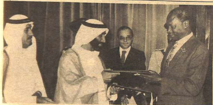
MTUKUFU Rais Moi akibadilishana hati na Rais wa Falme za Umoja wa Nchi za Kiarabu, Mtukufu Sheikh Zaid Zayed Bin Sultan Al-Nahayan baada ya kutia saini taarifa ya pamoja, Ikuu, Nairobi.