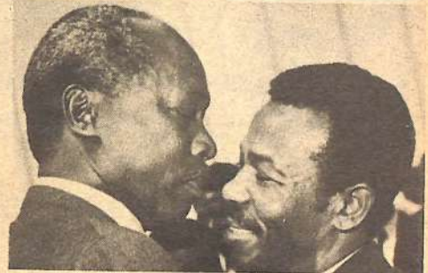
KARIBU... Rais Moi anamkaribisha Mwenyekiti wa Umoja wa Nchi Huru za Kiafrika, Mengistu Haile Mariam ambaye pia ni Kiongozi wa Ethiopia katika Uwanja wa Jomo Kenyatta mjini Nairobi.